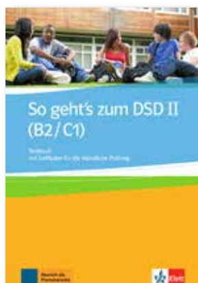
So geht's zum DSD II (B2/C1) Testbuch mit Leitfaden für die mündliche Prüfung