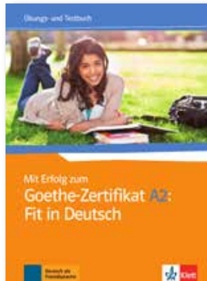
Mit Erfolg zum Goethe Zertifikat A2: Fit in Deutsch