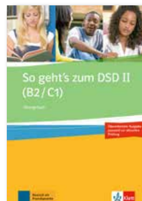
So geht's zum DSD II (B2/C1) Übungsbuch