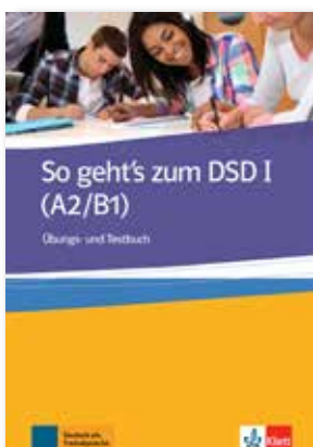
So geht's zum DSD I (A2/B1) Übungs- und Testbuch