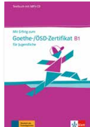
Mit Erfolg zum Goethe-/ÖSD Zertifikat B1 für Jugendliche