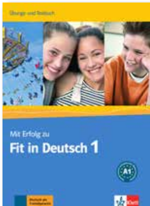
Mit Erfolg zu Fit in Deutsch 1